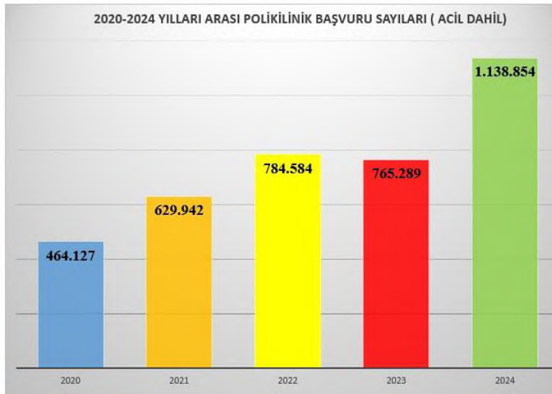
Şekil 2 - Yıllara Göre Poliklinik Başvuru Sayıları