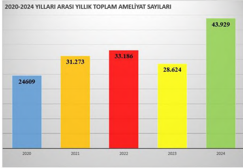
Şekil 3 - Yıllara Göre Ameliyat Sayıları

2024 yılında Araştırma ve Uygulama Hastanemiz bünyesinde bulunan laboratuvarlarda 4.506.393 adet test, 291.375 adet radyoloji tetkiki yapılmıştır. Test ve tetkiklere ilişkin ayrıntılı sayılar aşağıdaki tablolarda gösterilmiştir.